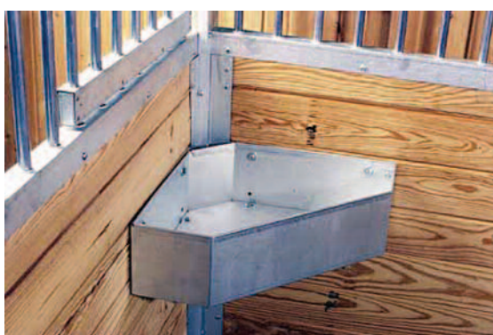
Mangeoire d'angle N° 60