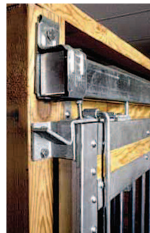
Système de verrouillage par le haut