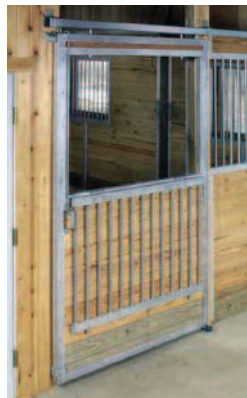
Porte de la stalle