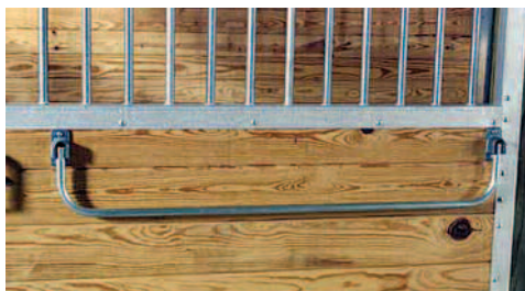
Barre à couverture N°100