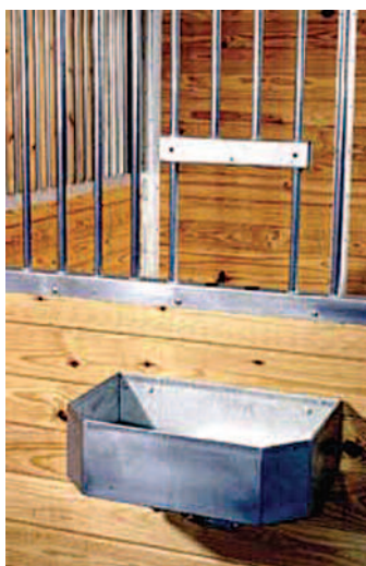
Trappe d'alimentation avec mangeoire murale N° 50